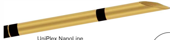
UniPlex NanoLine con punta facetada

El recubrimiento NanoLine es transparente y tan delgado que solo puede ser percibido por el color dorado claro. El punto de contacto para la estimulación nerviosa en la punta de la cánula permanece sin aislamiento.